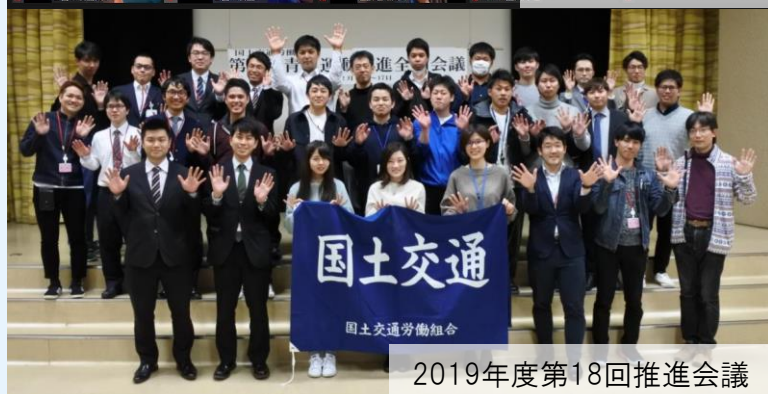
2019年度第18回推進会議

6月6～7日（日・月）にかけて 第20回青年運動推進全国会議を 開催するとともに、国土交通省 本省（官房）交渉を配置し、 私たち青年の要求を訴えます。 現地での参加はもちろん、Zoomを 用いたオンライン参加もできるの で、気軽に参加してください！