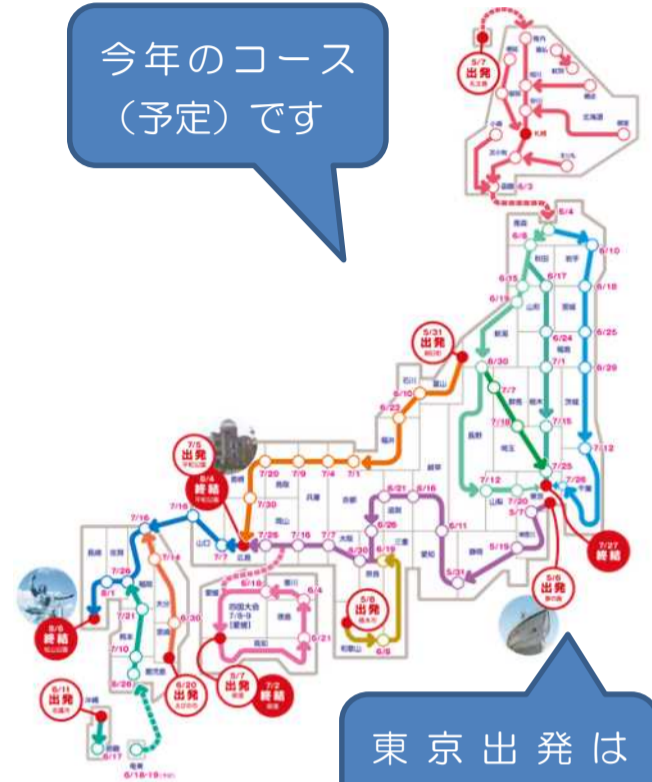
東京出発は 5/6でした。

※「2023年原水爆禁止国民平和行進」は核兵器の廃絶をめざし、8月の広島・長崎にむかって全国で行進する行動です。毎年、各県をリレーするかたちで実施されており、今年で66回目となります。8月まで、各地まだ行進中です（見かけたらご参加ください！どなたでも参加できます）。